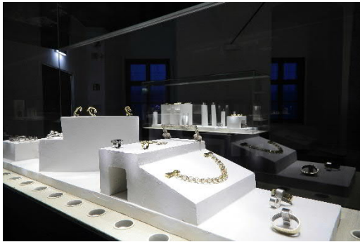
Ausstellungsansicht_Anna Heindl. Longtime Love Affairs_1.jpg Blick in die Ausstellung „Anna Heindl. Longtime Love Affairs“, Schlossmuseum Linz