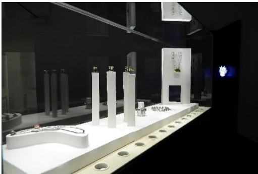
Ausstellungsansicht_Anna Heindl. Longtime Love Affairs_2.jpg Blick in die Ausstellung „Anna Heindl. Longtime Love Affairs“, Schlossmuseum Linz