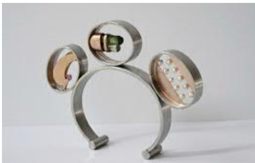
Anna Heindl, Flying.jpg Anna Heindl, Flying, 2015, Armreif Rotgold 585, Edelstahl, Turmaline, Perlen, Rubin © Anna Heindl