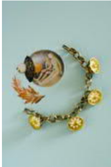
Anna Heindl, Blütenkugeln mit Perlen.jpg Anna Heindl, Blütenkugeln mit Perlen, 2006 Armband, 18k Gelbgold, Silber geschwärzt, Perlen © Anna Heindl

Die Pressebilder stehen auf www.ooelkg.at zum Download bereit. Lizenzfreie Nutzung nur unter Angabe des Bildrechts und nur im Rahmen der aktuellen Berichterstattung zur Ausstellung erlaubt.