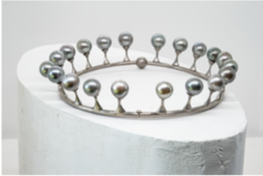
Anna Heindl, Milchtropfen.jpg Anna Heindl, Milchtropfen, 2013 Collier, 18K Weißgold, Tahiti-Perlen © Anna Heindl