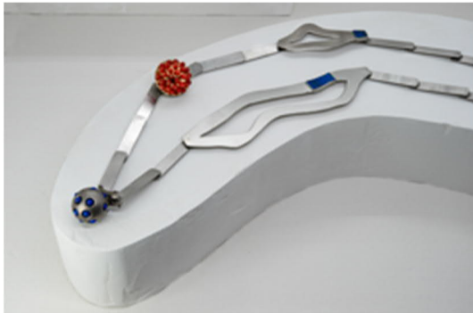
Anna Heindl, Der blaue Planet und die Sonne.jpg Anna Heindl, Der blaue Planet und die Sonne, 2020, Collier, 18k Weissgold, Lapislazuli, 18k Gelbgold, Korallen, Edelstahl © Anna Heindl