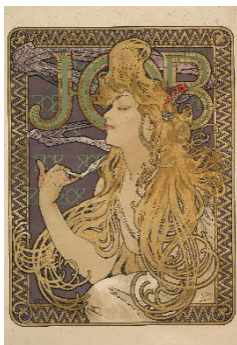
Alfons Mucha, Job, 1897.jpg

Jules Chéret, Folies-Bergère. La danse du feu, 1897, Farblithografie, Foto © Musée d'Ixelles-Bruxelles / Courtesy of Institut für Kulturaustausch, Tübingen