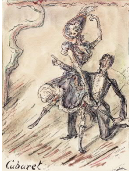
Alfred Kubin, Cabaret, um 1920.jpg

Alfred Kubin, Cabaret, um 1920