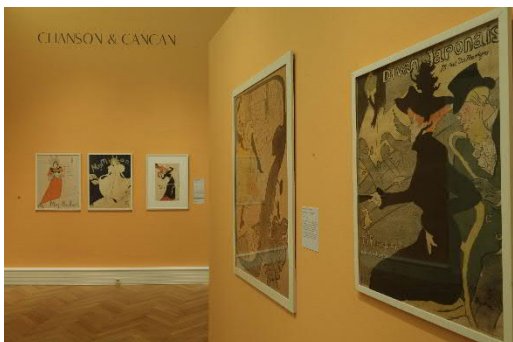
Ausstellungsansicht_ La Bohème. Toulouse-Lautrec und die Meister vom Montmartre_5.jpg

Blick in die Ausstellung „La Bohème. Toulouse-Lautrec und die Meister vom Montmartre“, 17. Okt. 2019 bis 19. Jän. 2020, Landesgalerie Linz