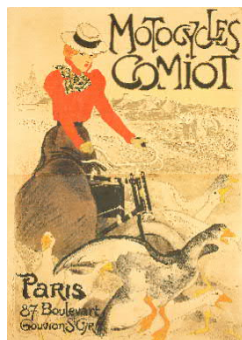
Théophile-Alexandre Steinlen, Motocycles Comiot, 1899.jpg

Alfons Mucha, Job, 1897, Farblithografie