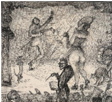
Alfred Kubin, Theaterszene, 1907.jpg

Alfred Kubin, Cabaret, um 1920 © Eberhard Spangenberg, München / Bildrecht Wien 2019