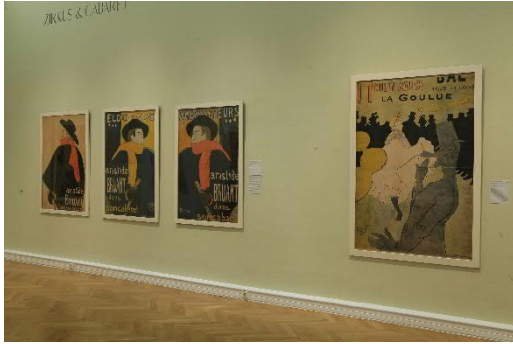
Ausstellungsansicht_ La Bohème. Toulouse-Lautrec und die Meister vom Montmartre_2.jpg

Blick in die Ausstellung „La Bohème. Toulouse-Lautrec und die Meister vom Montmartre“, 17. Okt. 2019 bis 19. Jän. 2020, Landesgalerie Linz