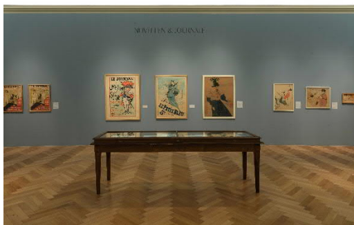
Ausstellungsansicht_La Bohème. Toulouse-Lautrec und die Meister vom Montmartre_1.jpg

Théophile-Alexandre Steinlen, Motocycles Comiot, 1899, Farblithografie