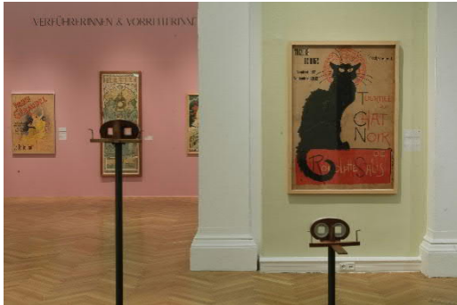
Ausstellungsansicht_ La Bohème. Toulouse-Lautrec und die Meister vom Montmartre_3.jpg

Blick in die Ausstellung „La Bohème. Toulouse-Lautrec und die Meister vom Montmartre“, 17. Okt. 2019 bis 19. Jän. 2020, Landesgalerie Linz