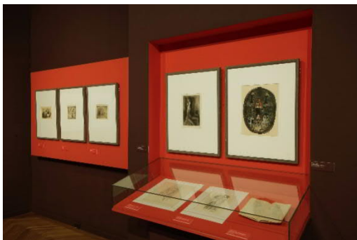
Ausstellungsansicht_Dämonische Verführung. Alfred Kubins

Alfred Kubin, Theaterszene, 1907, Sammlung Rombold