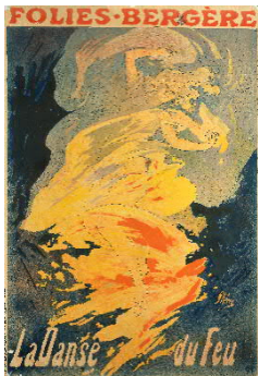
Jules Chéret, Folies-Bergère. La danse du feu, 1897.jpg

Théophile-Alexandre Steinlen, Tournée du Chat Noir, 1896, Farblithografie