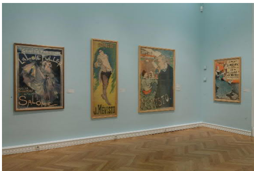
Ausstellungsansicht_ La Bohème. Toulouse-Lautrec und die Meister vom Montmartre_4.jpg

Blick in die Ausstellung „La Bohème. Toulouse-Lautrec und die Meister vom Montmartre“, 17. Okt. 2019 bis 19. Jän. 2020, Landesgalerie Linz