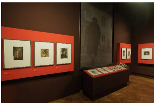
Ausstellungsansicht_Dämonische Verführung. Alfred Kubins

Blick in die Ausstellung „Dämonische Verführung. Alfred Kubins Frauendarstellungen“, 17. Okt. 2019 bis 19. Jän. 2020, Landesgalerie Linz